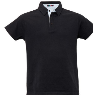
05 – NERO