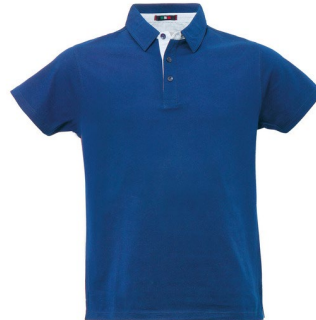
01 – ALBASTRU REGAL