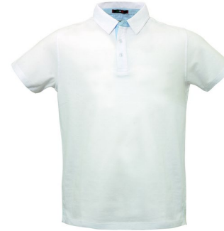
02 - WHITE