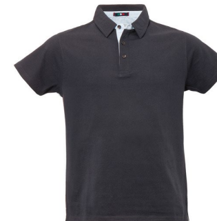
16 – ANTRACITE