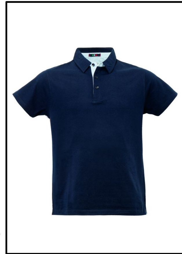
01 – BLU