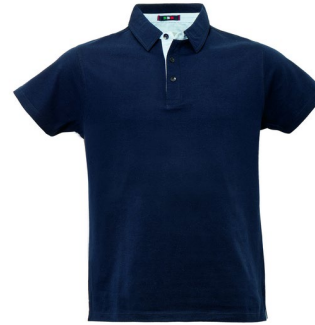
01 – BLEUMARIN

Tricou Polo cu bandă de protecție contra transpirației din material Oxford de culoare contrastantă pe guler și sub guler, guler închis cu trei nasturi și despicăături laterale în partea inferioară cu inserție de culoare contrastantă.